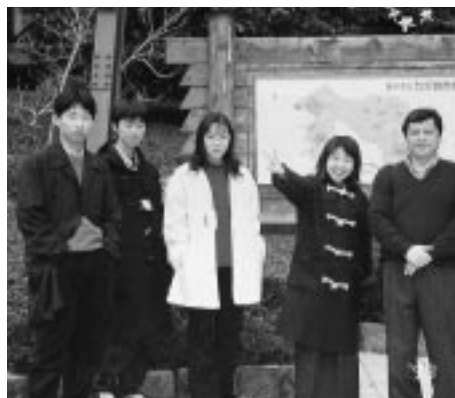
七沢の自然の中で(トランペット)

みなさんこんにちは。キャンプが終わってからの生活を送っていますか？キャンプで学んだことを活かしていますか？今、私はやる事がたくさんあるのにも関わらず編集長を引き受けてしまい、混乱状態でした。そんな時、友達から「困ったら乗り越えられる人にだけやってくれよ」と言われました。本に載っていた言葉らしいですが、こんなに言葉が身に染みて有り難いと思ったことは初めてでした。その友達が私に教えてくれたように、自分がキャンプで学んだ事、良かった事や悪かった事は、あなたも人に教えてあげてください。その人がその事に気づかず悩んでいるかも知れないですからね。そして、やはり友は財産ですね。キャンプでできた友達もできる限り連絡をとりたいですよ。もし自分の周りに、自分とは合わない、イヤだな、と思っている人がいても、ちょっと視点を変えてみて下さい。良いところが必ずあります。そうして輪を広めていくこともとても大切ですよ。とても貴重なキャンプ体験をもっと頭を使って最大限有効に活用しましょう。きっと自分が一人一人になるのがわかると思いますが、まずは自分でよく考えることが出発点です。お互い頑張ってみよう。すばらしい大人を目指して。この「Youth Journal」を読んだ感想、苦情などのお便りは編集長の私までともしどしどしお願いします。住所は一面の右上をご覧ください。