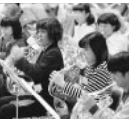
真剣な眼差しの参加者(ホルン)

コンサートマスターのメッセージ 今年、TYOCも終わりました。皆さんは今どんなことを考えているのでしょうか。様々なことを学び、また思い出もできたでしょう。では、「次回(や将来)への抱負は?」と聞かれた時、どう答えますか。TYOCは皆さんの協力を得て素晴らしい環境で集中して音楽を学べる、絶好の機会となっています。ですがこの機会を生かせるかどうかは、私達個人がどれだけ貪欲に四日間を過ごすかにかかっているのです。オーケストラというものを学び、