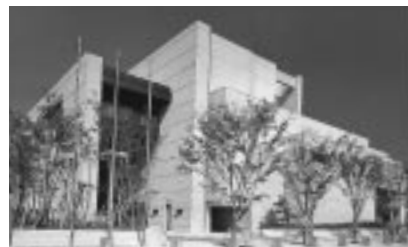
市川市文化会館外観

へいつて、まわりの仲間と息を合わせて音を出し、合奏をすることに楽しみを見出している仲間です。いくら電子的な技術が発達しても、人が自分の力で音を作りだしそれが重なりあつて、オーケストラとなる魅力は、その場にいる人たちでなければ味わえない大きな感動です。真夏の太陽の中、参加者の皆さんが市川をめざして来ていただき、それぞれのオーケストラのなかで共鳴しあい、響きを吹き飛ばす名演奏が生まれ、客席から多くの拍手が沸き上がる、そのような大会にしたいと思つております。皆様には大会期間中なかとご不便をかけることもあるかと思いますが、ホストオーケストラとしてできる限り皆さんのお世話をいたしますので、お楽しみに市川の会場へおいでください。ますようお待ちしております。