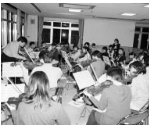
2ndVnパート練習：二人の講師の指導のもとで